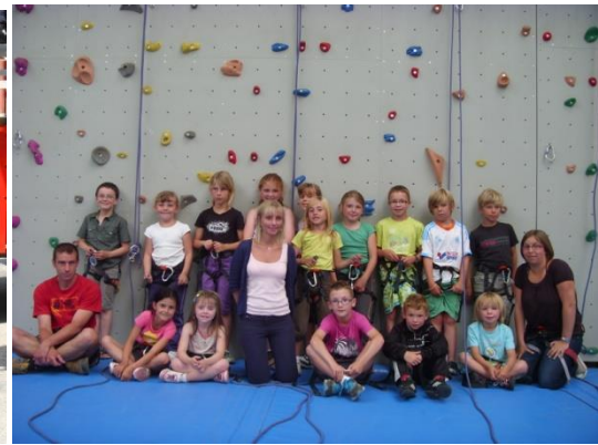
Et du sport