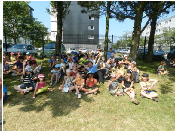
Fait des grands jeux