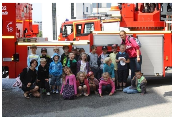
Fait des sorties