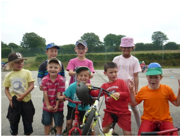
Joue dehors avec les copains